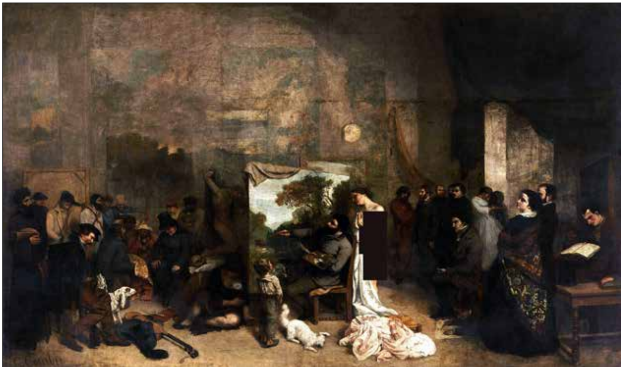
تصویر ۱: گوستاو کوربه، کارگاه نقاش یا تمثیلی واقعی از مجموع هفت سال زندگی هنری و اخلاقی من، L'Atelier du peintre. Allégorie Réelle déterminant une phase de sept années de ma vie artistique (et morale) (۱۸۵۵)، تکنیک اثر: رنگ و روغن روی بوم، ابعاد اثر: ۳۶۱ در ۵۹۸ سانتی‌متر، محل نگهداری: موزه اوریسی، پاریس، فرانسه (URL4).

نه رئالیسم؛ زیرا این رئالیسم است... در آن آدم‌هایی هستند که با زندگی رشد می‌یابند، کسانی که با مرگ کامیاب می‌شوند؛ این اجتماع در بهترین و بدترین و حد وسط آن [...] صحنه در کارگاه من در پاریس قرار دارد. تصویر به دو بخش تقسیم شده است. من در مرکز هستم و در حال نقاشی کردن؛ در سمت راست، (سه‌م‌داران) یعنی دوستانم، کارگران، گردآورندگان آثار هنری، در سمت چپ، دیگران؛ دنیای ناچیزها: عامه مردم، بی‌نویان، تهیدستان، ثروتمندان، استمارشدگان، بهره‌کشان؛ آن‌ها که با مرگ کامیاب می‌شوند. روی دیوار در پس‌زمینه، (بازگشت از هفته بازار) و (آبتنی‌کنندگان) [دو اثر نقاشی دیگر از آن کوربه] آویزان است» (پاکباز، ۱۳۶۹: ۲۳۳-۲۳۲). کوربه در غرفه رئالیسم ۴۰ اثر خود از جمله پرده‌های کارگاه نقاش و تدفین در ارنان را در معرض دید همگان قرار داد و مانیفست رئالیسم خود را عرضه کرد (همان: ۲۳۳).